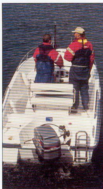
Den 60 hestes Mariner motor, der var monteret på test-båden, gav 5202'eren en fart på lige omkring 28 knob.

Den gode vægtfordeling og balance i båden betyder også, at der ikke er en væsentligt planings-