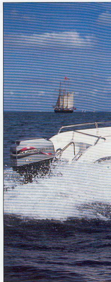
Gammelt og nyt på Øresund fanget i fotografens søger. Hver for sig smukke skibe – men afgjort to vidt forskellige verdener!

Under bænksædet er der ligeledes et stort rum, hvor der er adgang via en vandtæt luge. Men i dette rum er batteriet placeret, så