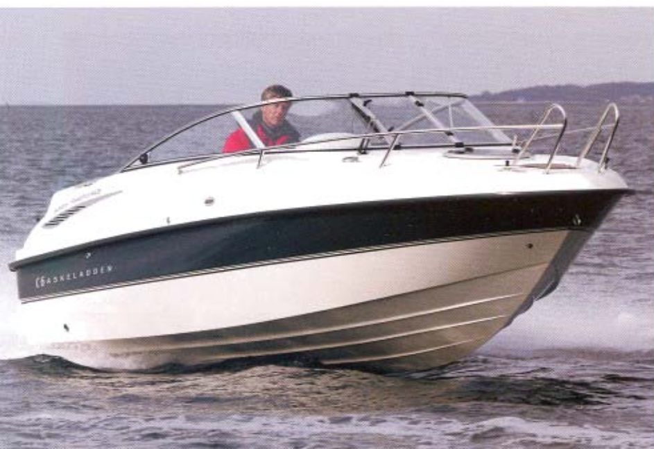
Båden sejler fint og kan holde overraskende høj marchfart i krap sø på 0,5-1 meter.

man har brug for – bade/redningslejder, håndlister og vandskikrog.