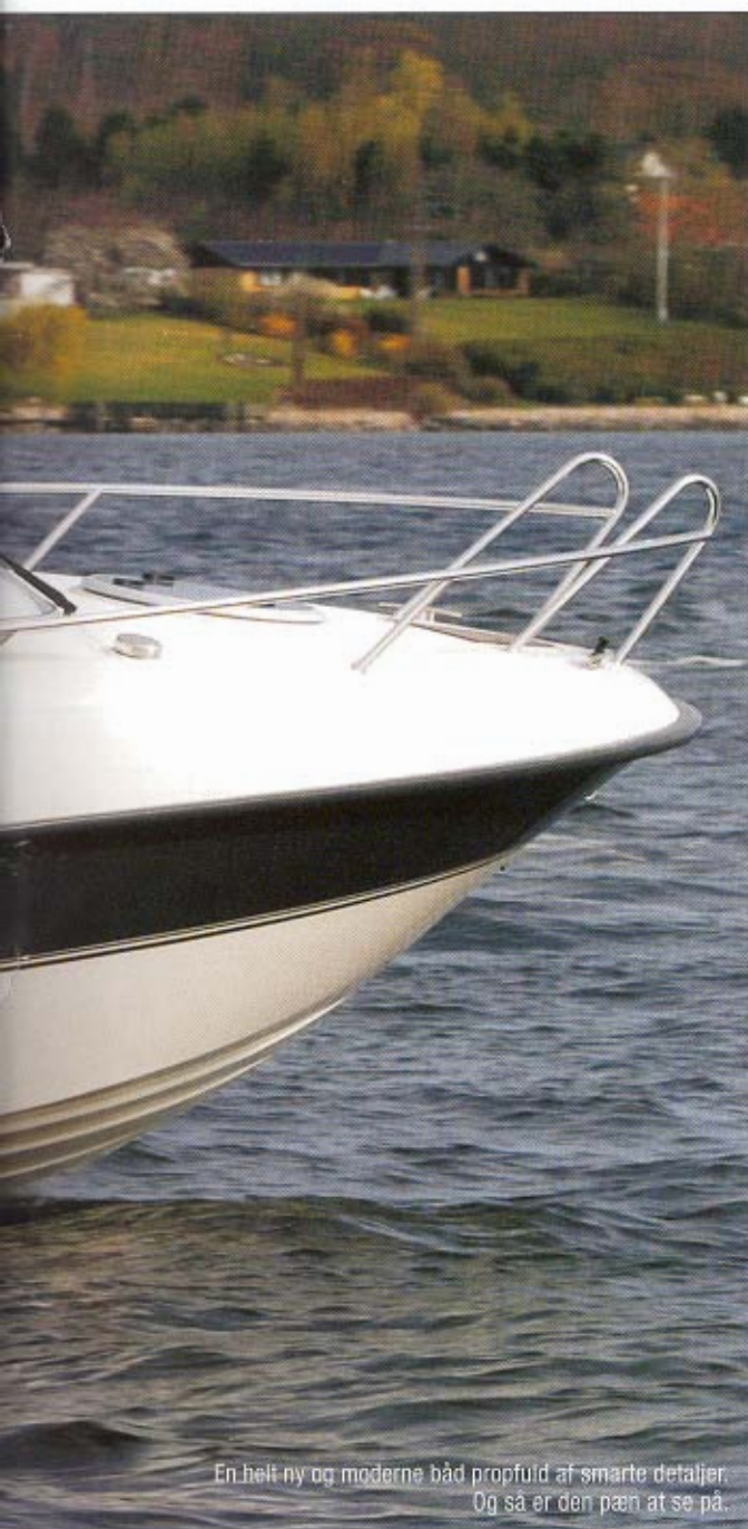
En helt ny og moderne båd præget af smarte detaljer. Og så er den pæn at se på.

Producenten taler om at C6-modellen danner platform for en ny serie. Vi kan altså vente os flere nyheder i samme serie. Det er ikke så dumt, for der er meget godt ved C6-modellen. Den skiller sig ud med en varm gul farve på skrog og dæk. Matchet med sort staffering, sort kaleche og mørke felter på stole og hynder. At man vælger andre farver end hvidt og blåt er spændende nok, men det kan jo være at enkelte kunder ikke vil have en gul båd og derfor bør der være flere valgmuligheder.