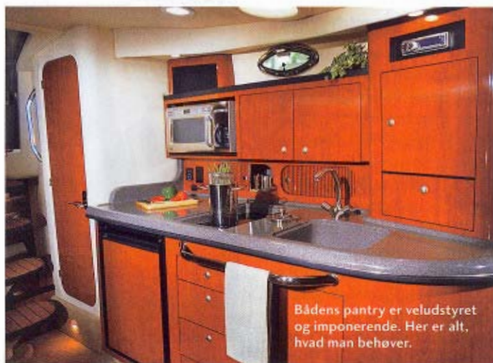
Bådens pantry er veludstyret og imponerende. Her er alt, hvad man behøver.