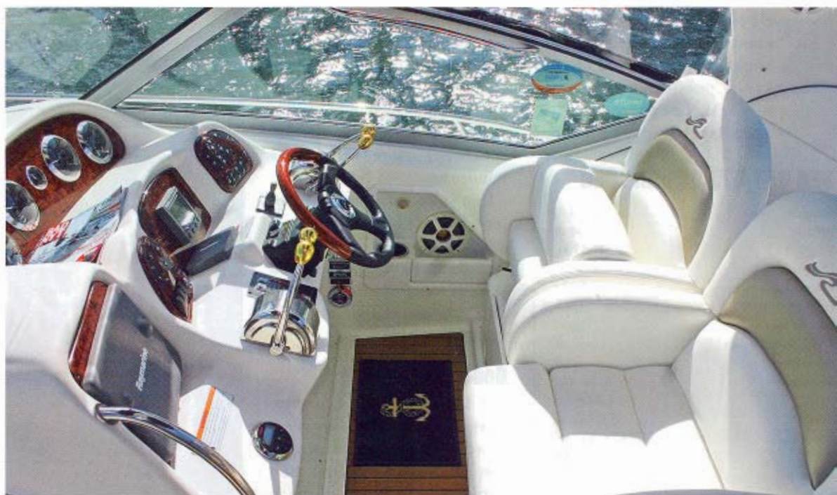
En meget stor og fornem førerposition med pragtfulde sæder i hvidt skind. Blandt finesserne er blandt andet dobbelt gashåndtag.

Der er meget lys i salonen takket være fire store ovale koojer. Man har valgt at lægge det meget flotte og veludstyrede pantry i bagbords side. Dette er i træ og ser meget lækkert ud. Her er selvfølgelig en mikrobølgeovn, en rigtig ovn, to gasblus, to kummer til skyl og opvask, køleskab, fryser, god ventilation, over- og underskabe, skuffer