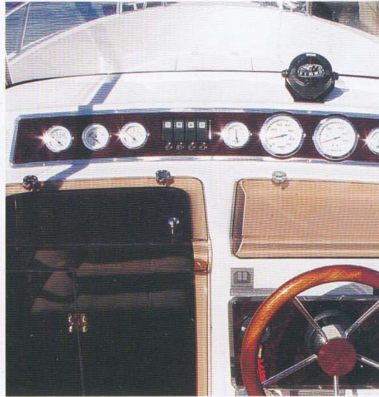
Et velfungerende instrumentbræt med kompasset lige foran vindspejlet.

er trang. En person kunne være i køjen på en i øvrigt tyk, behagelig madras, viste det sig, men en person mere til køjs ville være for højt spil var samtlige nordiske journalister enige om under stortesten i TanumStrand. Men køber man en Uttern S64 har føreren vel også råd til et hotelværelse, når man en sommerdag sejler til Anholt på få timer i et hæsblæsende tempo på helt op til 42 knob over grunden. I kahytten er der plads til at klæde sig om til aftenens middag på land og bagagen kan let staves af vejen om læ. Vi går derfor straks op i cockpittet til det det egentlig handler om. Her møder man et mindre cockpit for primært to personer, familiebåd er ikke et ord man forbinder Uttern S64 med. Førerstolene kan ikke vendes om til socialt samvær, om end der agter er placeret en lav bænk, hvor pladsen til benene er noget trang. I Uttern S64 sidder man nemlig på en solid førerbænk i offshore-stil. Bænken er boltet solidt ned i dørken og passer