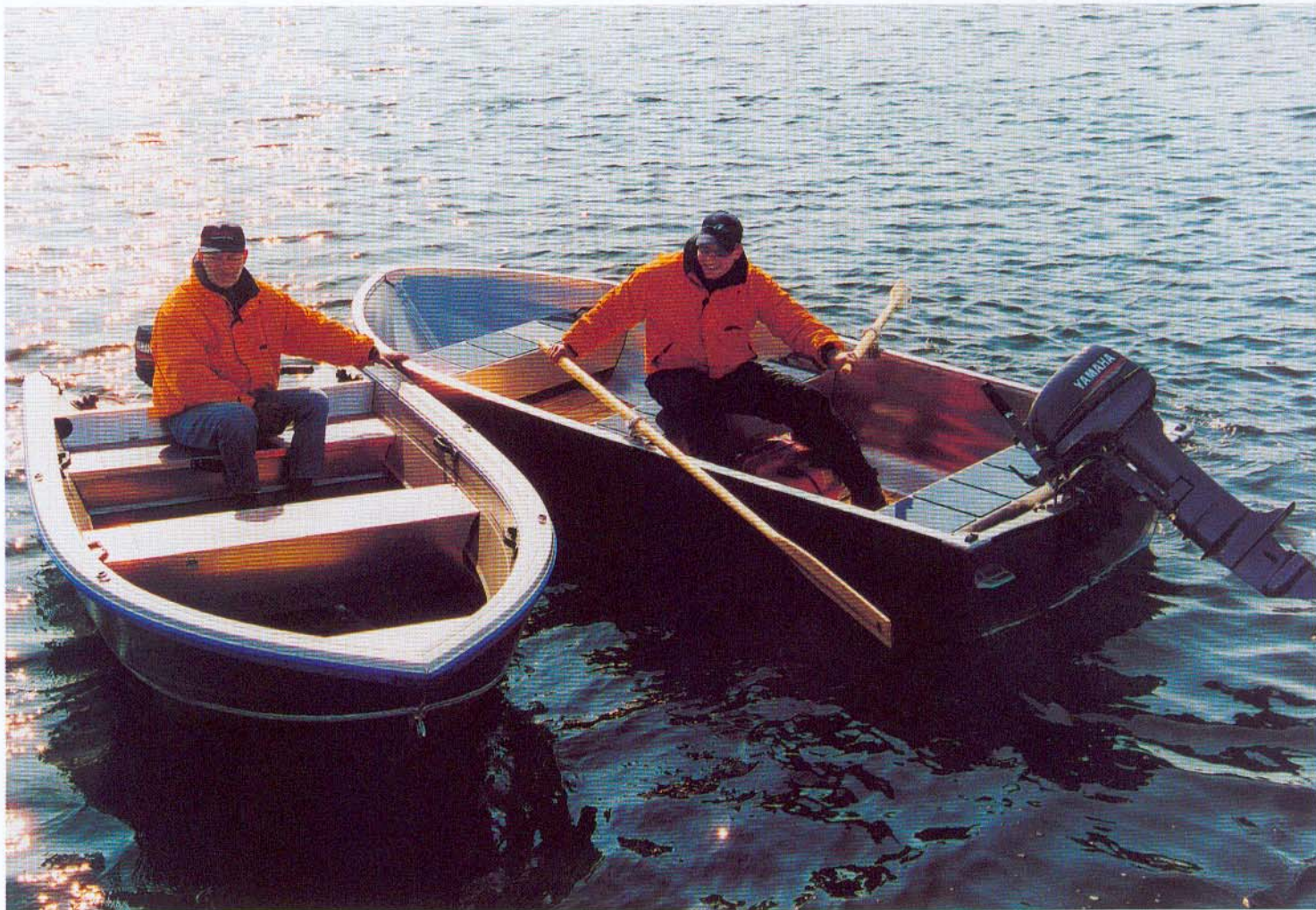
Buster XS til venstre og Linder 400 Sportsman til højre sejler næsten fuldkommen ens, med den samme 9,9 hk Yamaha-motor.